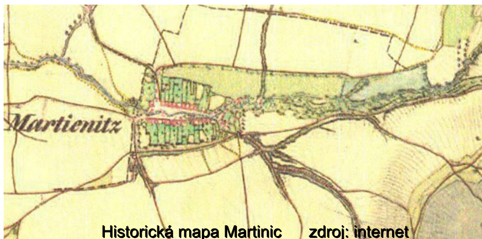
Historická mapa Martinic