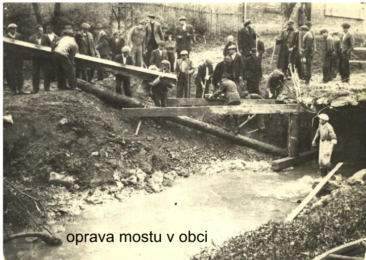
oprava mostu v obci