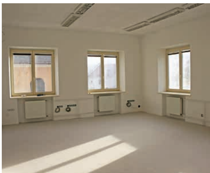
Třída po kompletní rekonstrukci.