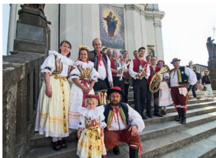
Setkání na Svatém Hostýně.

šťěstím, spokojeností, vzájemného porozumění a splnění všech dobrých předsevzetí a přání.