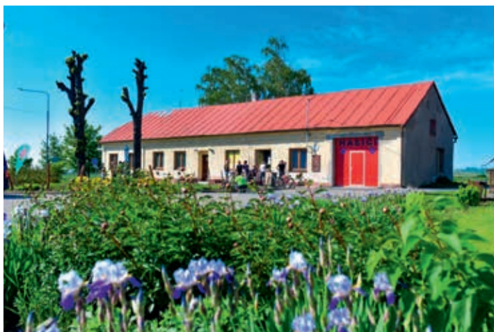
Během léta hasiči dobrovolně a ve svém volném čase natřeli fasádu budovy. Nyní je sněhově bílá.