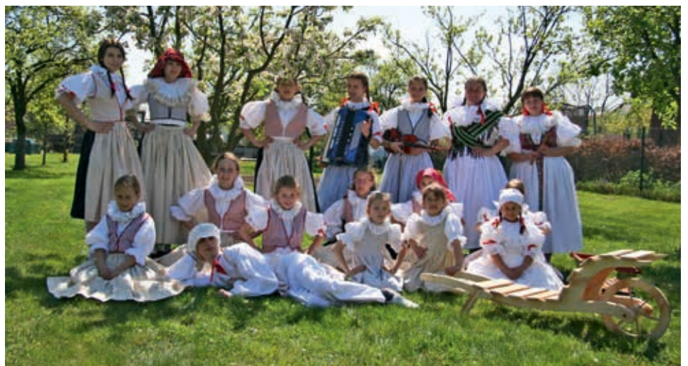
Členové martinického spolku Jabloňka museli letos oželet spoustu vystoupení. Snad bude letošní sezóna lepší.