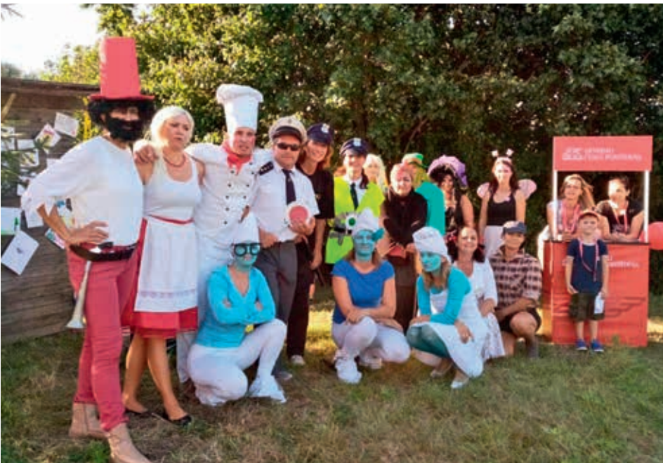
K létu neodmyslitelně patří Pohádkový les a letošní ročník se díky pořadatelům i návštěvníkům velice vydařil.