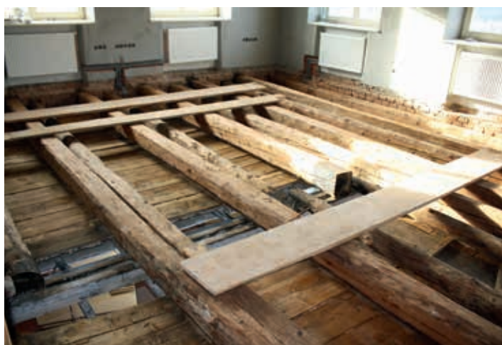
Třída před opravou.