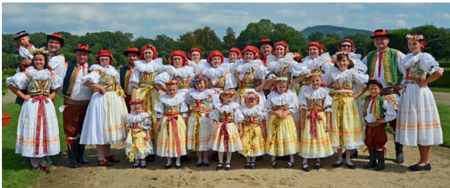
Omladina na Dožínkách v Holešově.