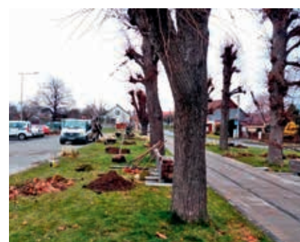
Práce při vysazování nových stromů.

Podle odborníka, který stromy vizuálně prohlédl a posuzoval je podle Standardu péče o přírodu a krajinu, je potřeba odstranit výmladky, které vyrostly po ořezu starých uschlých větví a u některých stromů provést hlavové řezy. V loňském roce se pokácely stromy, které byly uhnílé a ohrožovaly bezpečnost chodců a účastníků silničního provozu. Namísto toho se vysadily nové stromy za cenu 70 823 korun.