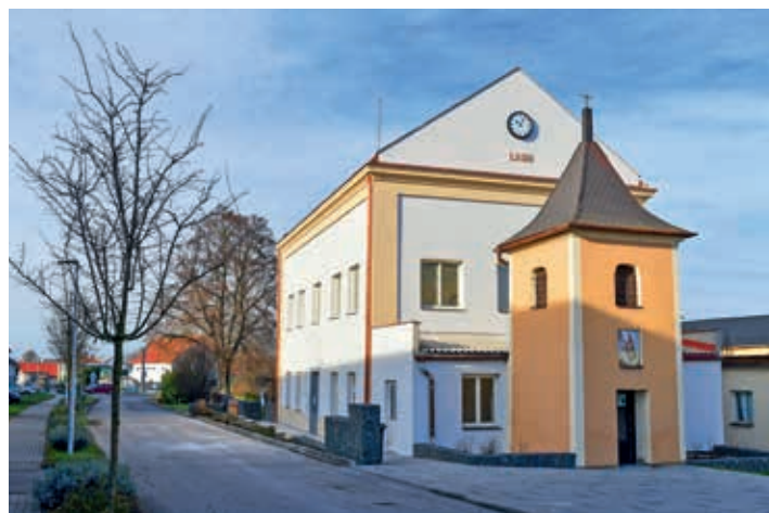
Základní škola je po rekonstrukci vyšší, zvedala se střecha.

Obec tak ke smlouvě o dílo podepsala dodatek číslo 2 a původní cena se navýšila