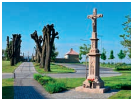
Alej před novou výsadbou.

„Není to tak, že bychom jenom káceli přestarlé a potenciálně nebezpečné stromy, zároveň průběžně vysazujeme novou zeleň nejen u hřbitova. Vysadili jsme mladé stromky u výběhu s koňmi a přibýly i další stromy v Rodinné aleji,“ dodal starosta.