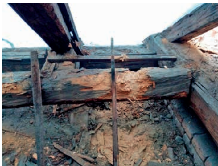
Stav trámů střechy před opravami.

Střecha i krovky byly v havarijním stavu a udělaly se nové. Také došlo k opravě fasády a udělalo se nové zázemí pro paní uklízečky. V letošním roce má obec v plánu přesunout do budovy základní školy knihovnu. Ta momentálně sídlí na obecním úřadě, v prostorách, které neposkytují dostatek