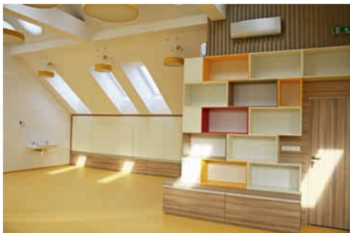
Místnost v podkroví je prosvětlená.

místa pro všechny knihy a také proto, aby zde paní knihovnice mohla pořádat větší akce.