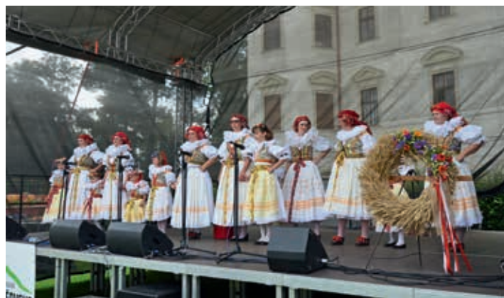
Při vystoupení v zahradě holešovského zámku.

Do nového roku Vám přejeme, aby nastávající rok 2021 byl naplněný pevným zdravím, láskou,