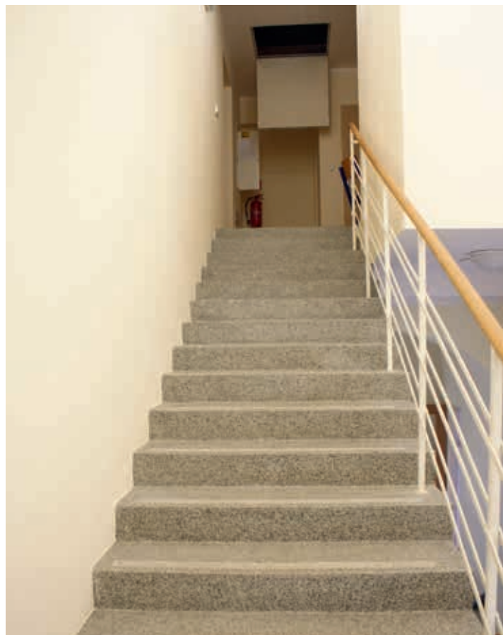
Nové schodiště do podkroví.