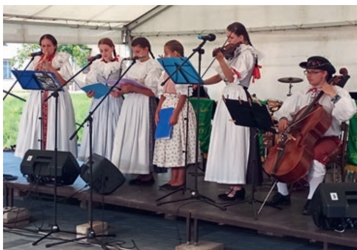
Jablůňka na hodech v Martinicích