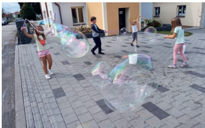
Hra s bublinami ve školní družině