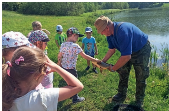
Výlet za rybářem

Začátek měsíce října jsme přivítali barevným týdnem, kdy jsme všichni sladili své oblečení do barev podzimu. Barevným týdnem nás provázelo téma „Ovoce a zelenina.“ Děti přinesly do školky své oblíbené kousky ovoce či zeleniny a konala se i jejich společná ochutnávka. K tomuto tématu se nám krásně hodil edukační program se čtením z knihy s názvem „Potíže s mrkví“, které si pro nás připravili v holešovské knihovně. Příběh, který nás všechny uchvátil, povídal o králíkovi, který měl rád tak moc mrkev, že se mu nevlezla do nory a způsobila nejen jemu, ale i jeho kamarádům velké potíže. Díky knize se děti zábavnou formou