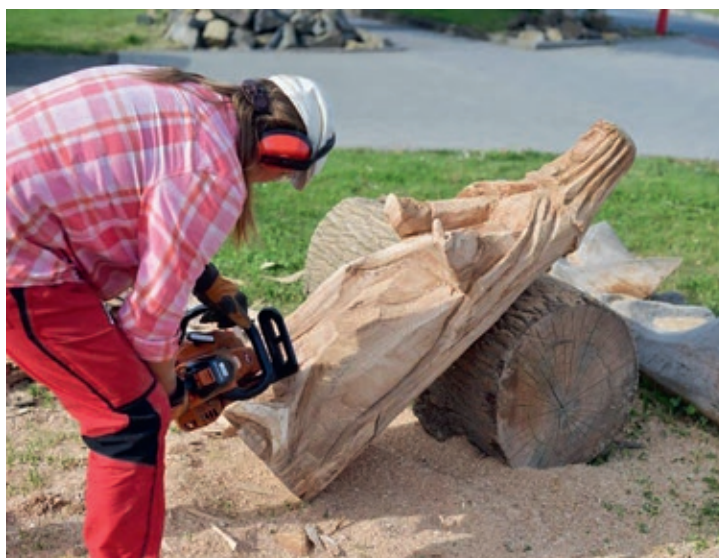
Vyřezávání dřevěných soch