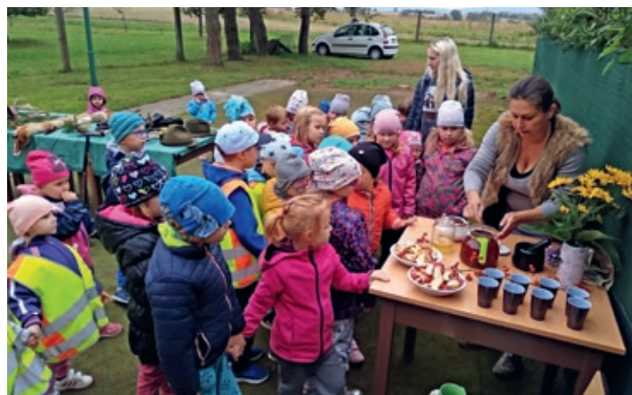
Program v myslivně