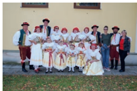
Místní soubor Omladina

Zastupitelstvo spolkům opět schválilo příspěvky z obecního rozpočtu na jejich činnost. Předcházející 2 roky byly poznamenané pandemií a všichni doufají, že letos už se nebudou muset žádné akce rušit. Díky podpoře