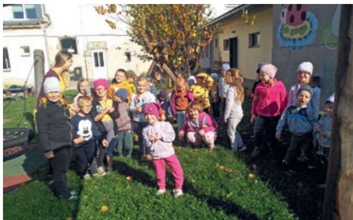
Program na zahradě