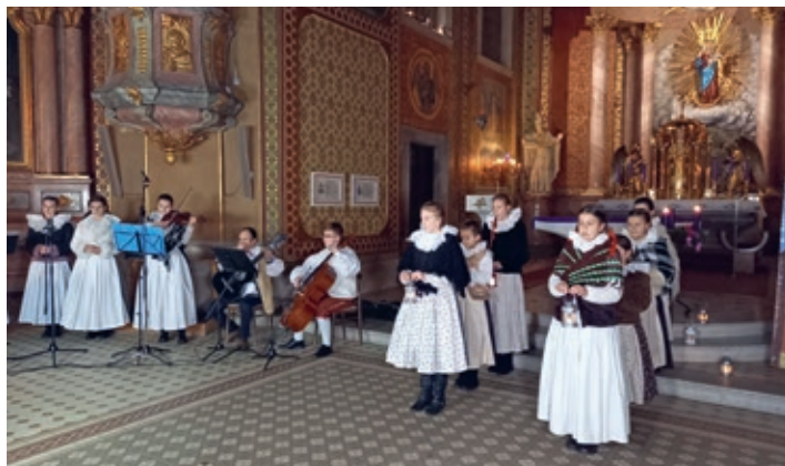
Jablůňka natáčela na Svatém Hostýně