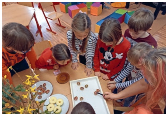
Beseda o vánočních zvycích

Vánoční besídky jsme si po dvouleté pauze také patřičně užili. Nejprve jsme si v rámci tříd zopakovali staré vánoční zvyky, udělali ochutnávku vánočního cukroví a po roční pauze, kdy bylo ve školách zakázáno zpívat, jsme se pak sešli u školního vánočního stromu a z plných plic si zazpívali koledy. Oproti roku 2020 to byla velmi příjemná změna. Nakonec si děti rozbalily společné dárky (hry a hračky), které jim teď slouží v družině.