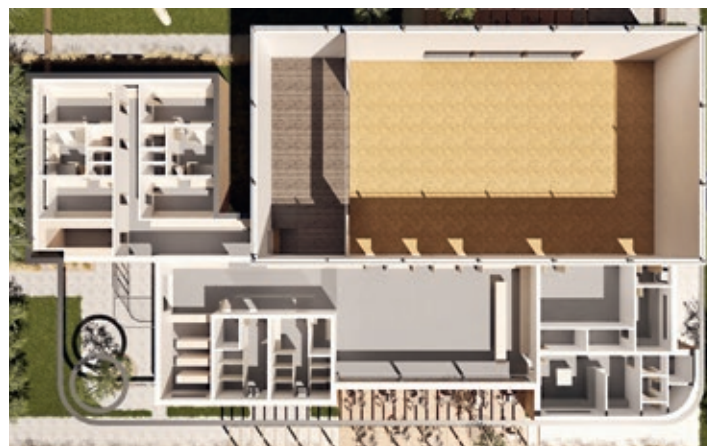
Prostory nového kulturního domu

Buduje se pro další generace, ať můžou říct, že se opravdu něco dělo, něco rostlo, něco budovalo. „Nebudme pořád závislí na starých, opotřebovaných a dnes již nedostačujících věcech, ale pokračujme a posouvajme se. Která vesnice v dnešní době bude novou školou, novou školku, novou halu, nový kulturní dům? Dlouhá desetiletí se nic nedělo.