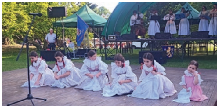
Vystoupení dětí v červenci letošního roku