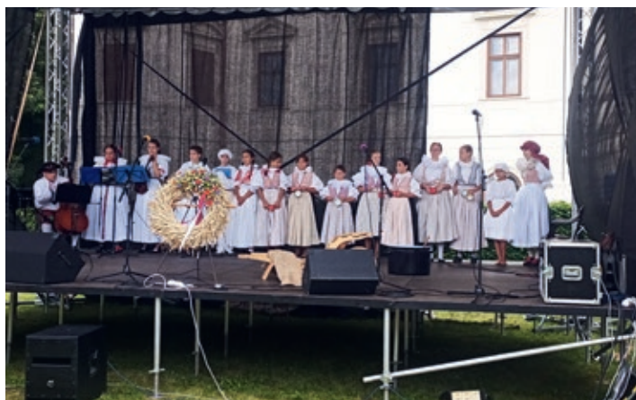
Vystoupení na Dožínkách v Holešově