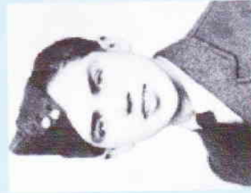
brig. gen. Emil Boček